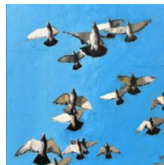
Salvo Catania Zingali