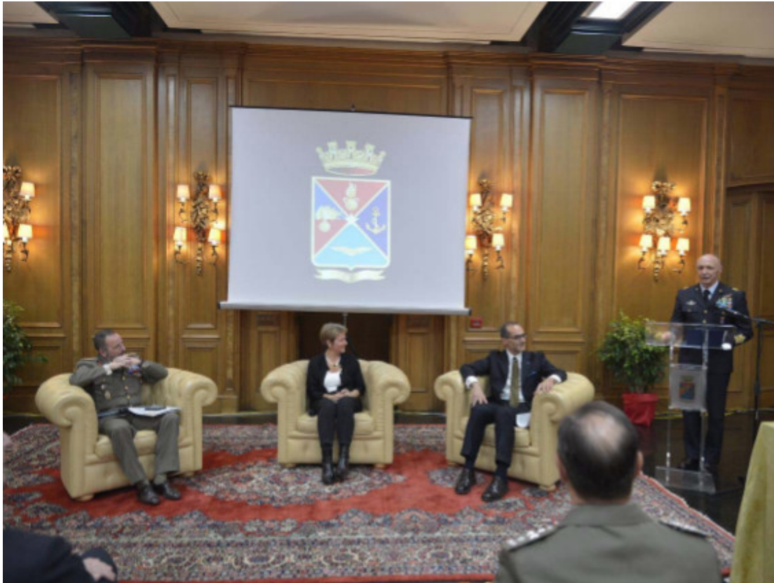
Presentazioni editoriali dello Stato Maggiore della Difesa

Presentati il libro sulle Bandiere custodite al Sacrario delle Bandiere all'Altare della Patria e il libro sulla Storia di Palazzo Esercito